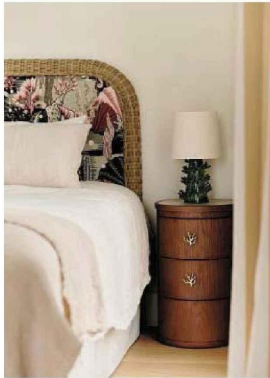
Les 53 chambres, toutes différentes, cultivent l'esprit d'une grande demeure familiale.

NICE L'hôtel, adossé à la colline du Château et situé au début de la promenade des Anglais, s'est offert une spectaculaire rénovation. Cette discrète adresse inaugurée en 1936 pourrait devenir l'un des meilleurs établissements d'une ville en pleine ébullition.