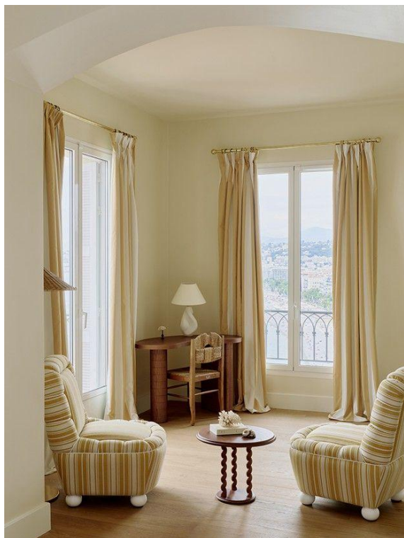
La décoration est signée du studio Friedmann & Versace.