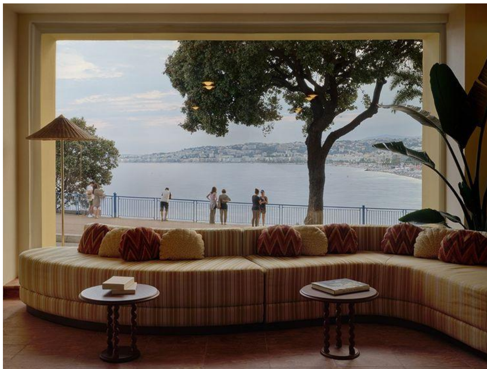
Depuis la réception, une vue imprenable sur la baie des Anges.