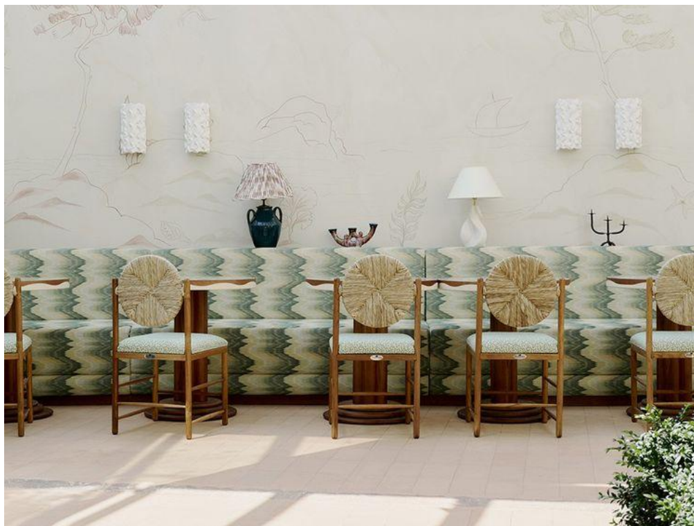
Le restaurant « Le Patio ».