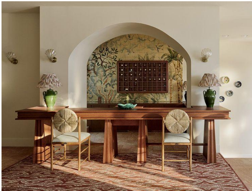
La réception.

Le concept. Rares sont les Niçois à connaître « La Pérouse ». Face au monumental « Negresco » ou à l'hôtel très en vue « Amour », le lieu est longtemps demeuré une énigme, tout au plus une belle façade face aux eaux turquoise de la Méditerranée, surmontée par un parc spectaculaire. L'adresse familiale prisée des Anglais (dont Elton John, qui y plaçait ses équipes) attirait une clientèle fidèle à un établissement qui avait vieilli face à la concurrence. Tout devrait changer avec ce nouveau départ. On y retrouve l'esprit d'une grande demeure familiale avec un service sur mesure. La mer, les vacances au soleil sont désormais le fil conducteur de ce repaire convoquant le meilleur du Sud, d'une fresque rappelant le souvenir de Jean Cocteau à une alcôve habillée d'un jaune pétillant, hommage aux agrumes de la Riviera. Le tout idéalement placé à deux pas du cours Saleya, célèbre pour son marché aux fleurs et ses brocanteurs chaque lundi.