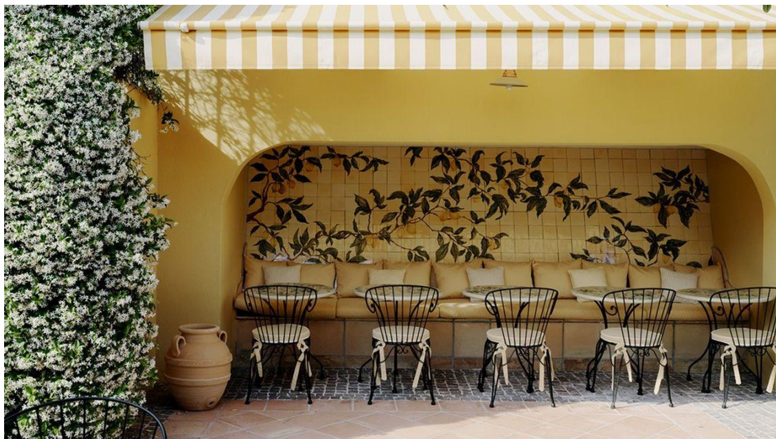
Sur la terrasse, une ambiance résolument « Sud ».

Situé au début de la promenade des Anglais, le discret hôtel « La Pérouse » s'est offert une spectaculaire rénovation tout en conservant son âme d'antan. Avec sa piscine et son jardin, il cultive l'esprit d'une grande demeure familiale dédiée aux vacances au soleil.